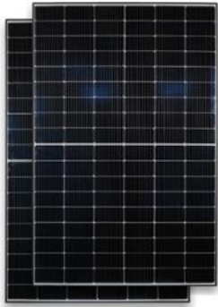
2x 2nd-Life Solarmodule

Was ist alles im Lieferumfang enthalten?