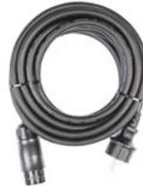
1x Schuko Kabel